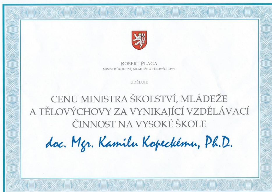
Cena ministra školství mládeže a tělovýchovy