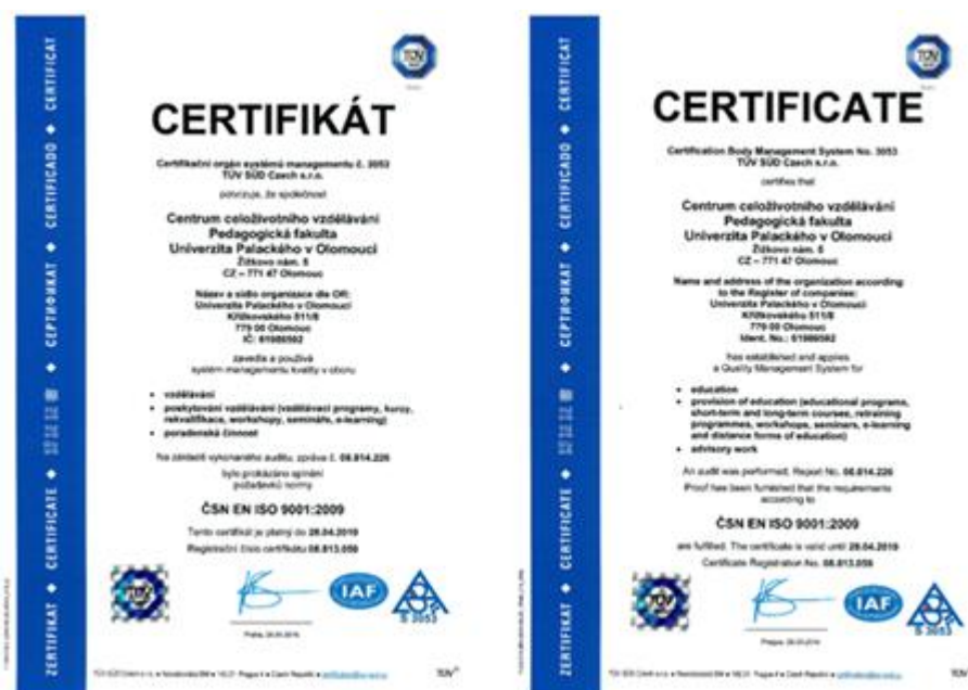
Mezinárodní certifikát kvality ISO 9001

V roce 2020 bylo CCV nadále držitelem mezinárodního certifikátu kvality ISO 9001. Pedagogická fakulta Univerzity Palackého se tak řadí mezi instituce mající celosvětově uznávaný standard kvality v oblasti poskytování služeb. Certifikát je každoročně obhájen na základě auditu u prestižního certifikačního orgánu TÜV SÜD Czech s.r.o., který je součástí mezinárodní skupiny TÜV SÜD Group. Předmětem certifikace je poskytování vzdělávání (vzdělávací programy, kurzy, rekvalifikace, workshopy, semináře, e-learning), vlastní vzdělávací proces i poradenská činnost.