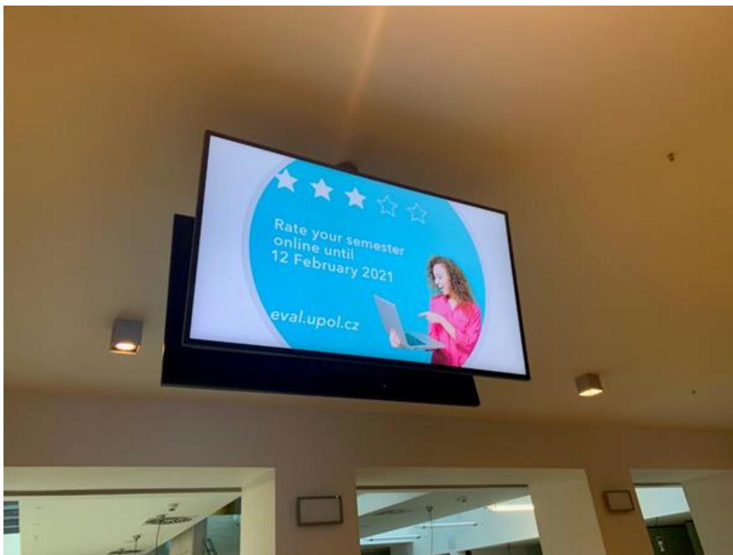
Informační systém ve vestibulu budovy PdF UP na Žižkově náměstí.